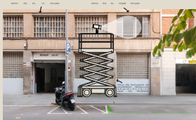
Acceso con montacargas, posibilidad de subir material al Home estudio con una grúa desde la calle o iluminar desde fuera. Zona de Vado y Carga-Descarga en el propio edificio.